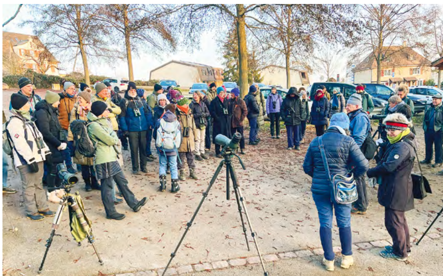
ELK: Exkursionen sind wichtig, um Wissen zu vermitteln und gemeinsam spannende Beobachtungen zu teilen.

Wir bedanken uns herzlich für die Unterstützung aus dem Verband und das Interesse!