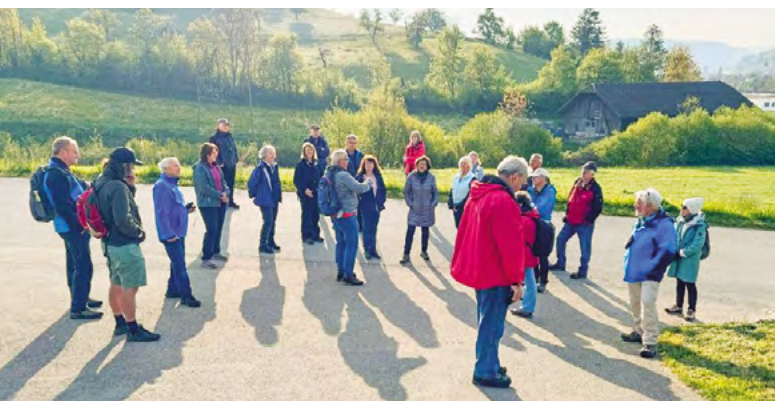
NVV Itingen auf Exkursion

Wir haben in unserer Gemeinde mehr als 250 Nistkästen platziert. Der grösste Teil ist für Kleinvögel wie Meisen, Kleiber usw. bestimmt. Daneben unterhalten wir auch ca. 25 Nistkästen für Turmfalken, Waldkäuze, Hohltauben, Mauersegler und sogar für Fledermäuse.