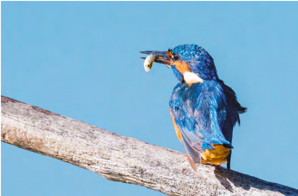
Der Vogel des Jahres 2026, der Eisvogel mit einem kleinen Fisch, oft das Hauptfutter.

Text Simon Hohl, Co-Präsidium BirdLife Baselland