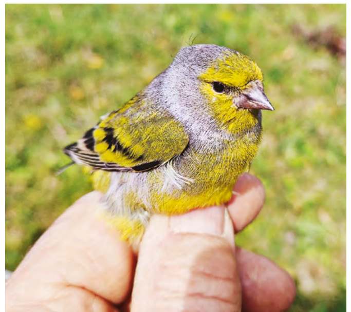
Der Zitronenzeisig brütet in den Gebirgen Mittel- und Südeuropas. Nördlich der Ulmet gibt es lediglich im Schwarzwald und in den Vogesen kleine Populationen mit aktuell stark rückläufigen Beständen.

Ein grosser Dank gilt den Familien Schneider und Brunner für das Gastrecht, der Vogelwarte Sempach für die Netze sowie allen ehrenamtlichen Helferinnen und Helfern für ihren unermüdlichen Einsatz bei oft schwierigen Bedingungen. Die 65. Ulmetaktion startet am 26. September 2026.