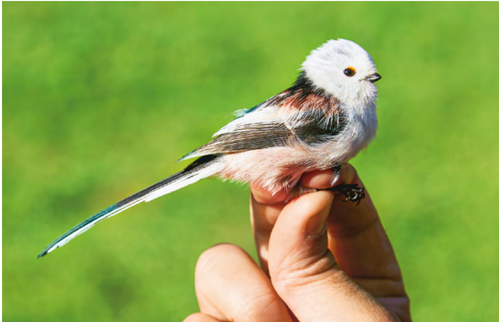
Schwanzmeise mit Merkmalen der Unterart caudatus

Text Nicolas Strebel für die Ulmetkommission