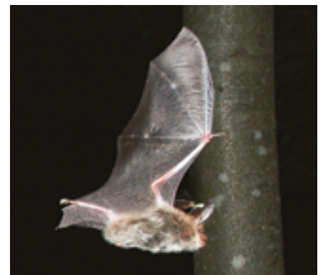
Bechsteinfledermaus fliegend im Wald