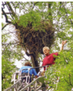
Mit der Feuerwehr Oberwil beim Einsatz für die Störche