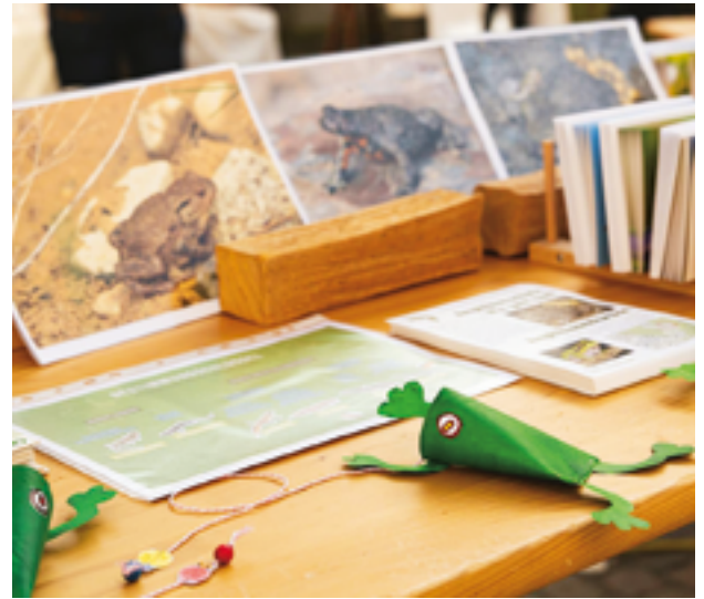
Froschspiel für Kinder am Frühlingmarkt 2024, Bild zVg.

Wir betreuen unsere lokalen Naturschutzgebiete mit Pflegeeinsätzen, schaffen Lebensräume, unterhalten das Amphibienlebenssystem, putzen unser Birsufer und beteiligen uns zusammen mit dem NV Dornach an der jährlichen Zugvogelzählung auf dem Gempfen. Auch die Frühlingsexkursion mit dem NV Ettingen war wieder ein Erlebnis. Zusammenarbeit ist uns wichtig!