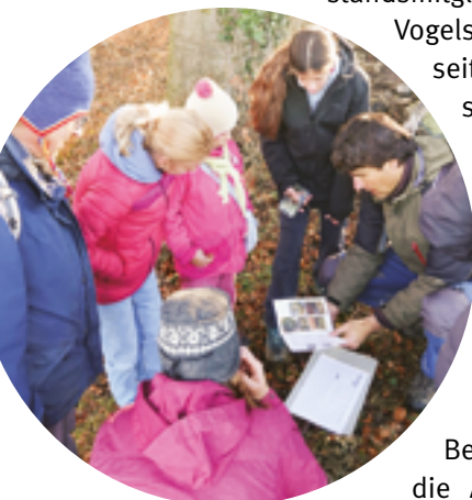
Nistkasten putzen mit Kindern im Januar 2024