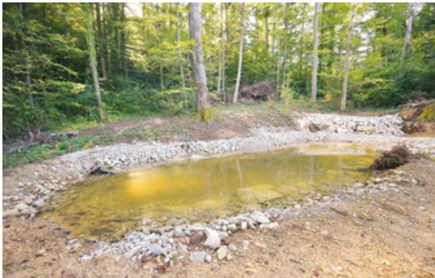
Hümpeliteich in Füllinsdorf

Text Céline Evéquoz & Franziska Studer, Ingenieurbüro Götz