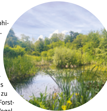
Naturschutzgebiet Bammertsgraben auf dem Bruderholz bei Bottmingen

Ein Waldrand ist ein besonderer Lebensraum, der bei uns leider selten geworden ist. In Frenkendorf gibt es nun wieder naturnahe Waldränder. Das ist einem Aufwertungsprojekt zu verdanken, bei dem Gemeinde, Forstrevier sowie der Natur- und Vogelschutzverein an einem Strang ziehen. So entstehen neue Lebensräume für Säugetiere, Vögel, Insekten und Co.