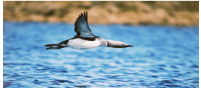
Prachtaucher, hier fliegend noch im Prachtskleid

Das Jahr 2024 tanzt witterungstechnisch bisher aus der Reihe. Es scheint, als hätte sich das nasse Frühjahr nicht unbedingt schlecht auf das Brutgeschehen der Vögel ausgewirkt. Man darf also auf die Ergebnisse der diesjährigen Aktion gespannt sein.