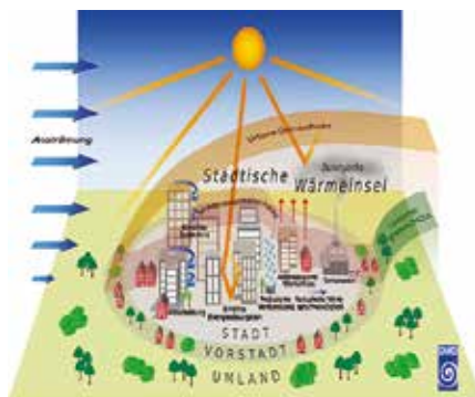
Das Stadtklima und seine Einflussfaktoren

Einst haben die gut durchströmten Wohngebiete ganz natürlich runtergekühlt, dank den vielen alten Bäumen, Sträuchern oder einfach auch sonstigen Grün- und Freiflächen. Doch durch die vielen (Nach-) Verdichtungsprojekte in zahlreichen urbanen