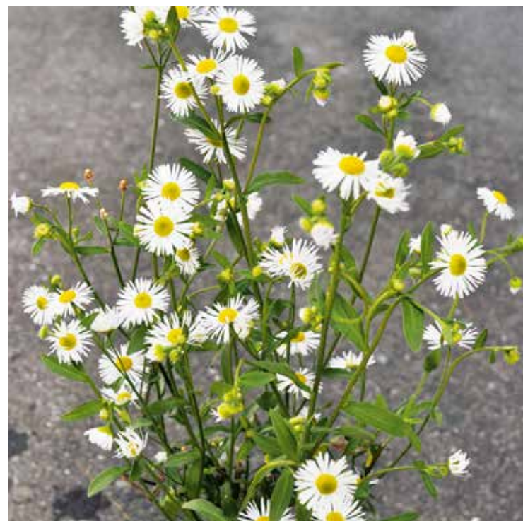
Einjähriges Berufkraut ( Erigeron annuus )