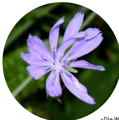
«Die Wegwarte»