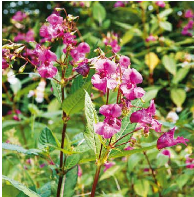
Drüsiges Springkraut ( Impatiens glandulifera )

Nebst der Koordination von Massnahmen ist die korrekte Anwendung von Bekämpfungsmethoden ein weiterer entscheidender Faktor. Mit der Herausgabe der Broschüre «Praxishilfe Neophyten» sowie weiterem Informationsmaterial, welches unter www.neobiota.bl.ch zur Verfügung steht, werden die lokalen Akteure mit Hilfsmitteln unterstützt. Ausserdem besteht für Naturschutzvereine und Gemeinden die Möglichkeit, beim AUE finanzielle Unterstützung zu beantragen, zum Beispiel für Freiwilligeneinsätze. Formulare und Wegleitung sind ebenfalls auf der kantonalen Neobiota-Website verfügbar. Der Fokus der kantonalen Aktivitäten liegt auf den Fließgewässern und den Naturschutzgebieten. Das Amt für Wald beider Basel ergreift mit dem neu geschaffenen Waldschutzdienst Massnahmen gegen Schadorganismen im Wald, zu denen auch einige invasive Neobiota gehören.