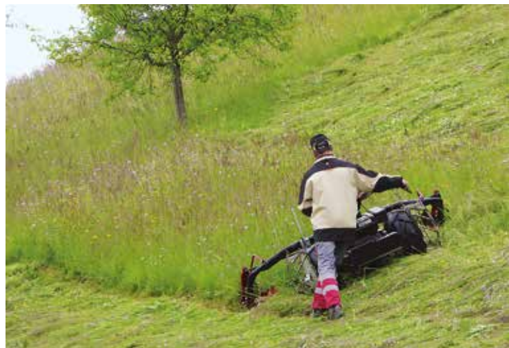
Kein Hang zu Steil für die modernen Hangmäher.

Moderne Balkenmäher sind sehr leistungsfähig, biodiversitätsschonend und auch in sehr steilen Hängen sicher. Aber sie sind nicht ganz billig. Darum werden sie auf der von Pro Natura Baselland und dem Ebenrain-Zentrum betriebenen Homepage www-hang-bl.ch für den überbetrieblichen Einsatz angeboten. In der Regel verrichtet der Anbieter die zu verrichtende Arbeit in Lohnarbeit. Neben Mäharbeiten werden auch Pflegeeinsätze im Bereich Hecken- und Waldrandpflege von Landwirten und Arbeitseinsätze von Sozialfirmen angeboten. Besonders attraktiv sind Ziegen und andere Weidetiere als Landschaftspfleger. So werden Naturschutzgebiete schonend und ohne Motorenlärm gepflegt.