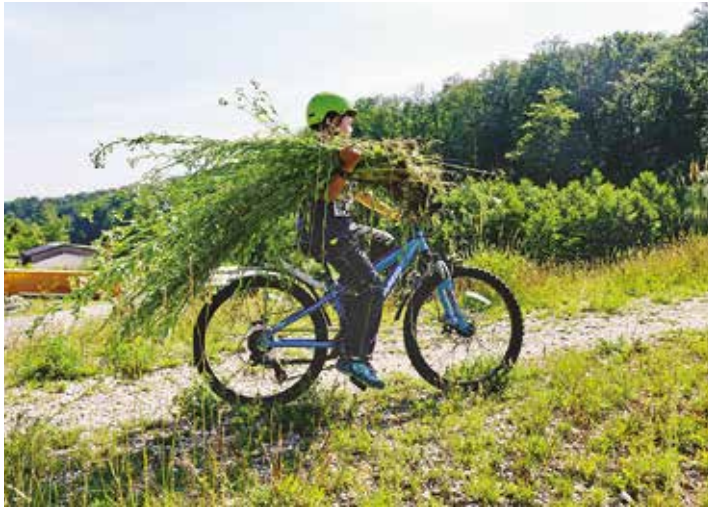
Speditives Arbeiten – Einer der jüngsten Helfer nutzte kurzerhand sein Velo, um den Abtransport des gejähteten Berufkrautes – zu beschleunigen.

Text Andreas Bammatter für die Freiwilligen