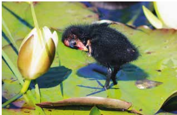
Teichhuhn-Küken ( Gallinula chloropus ), im Teich des «Biotop Am Stausee», Birsfelden

Der imposante Rotmilan kreist immer häufiger am Baselbieter Himmel, auch über Rickenbach. Der anpassungsfähige Greifvogel profitiert von der Nähe zum Menschen und der intensiven Landwirtschaft, die auch im einstigen «Bluescht-Hotspot» Rickenbach längst Einzug gehalten hat. Insekten werden seltener und mit ihnen verschwinden auch die typischen Feld-