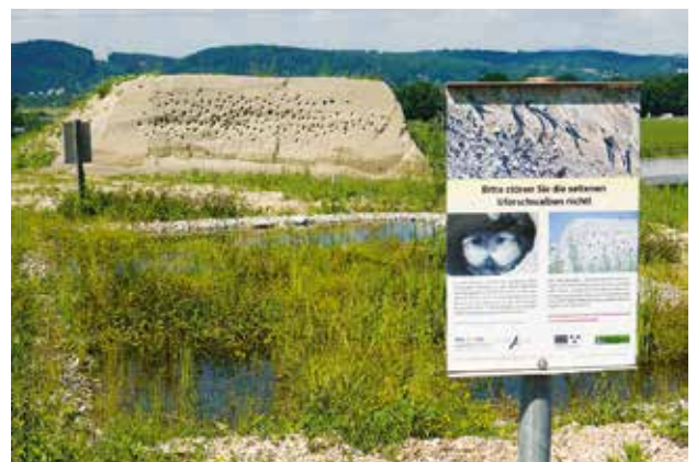
Erfolgreiche Sandschüttungen für Uferschwalben von BirdLife Schweiz und ihren Partnern: bereits 40% des Schweizer Bestands brüteten 2020 in derartigen Wänden.

Es stehen also wichtige Planungen und viel Arbeit für das Jubiläumsjahr an. Packen wir es gemeinsam an: für die Biodiversität – lokal bis weltweit!