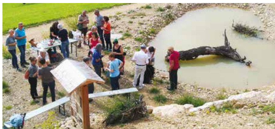
Weier von oben