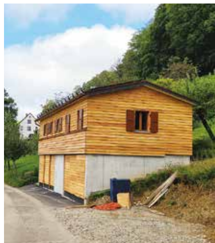
Die fast einzugsbereite neue Unterkunft der Beringungstation.

son hin etwas Grundlegendes geändert hat: Die Schubkarre ist Geschichte. Oder in anderen Worten: Mit der erfolgreichen Fertigstellung der neu-