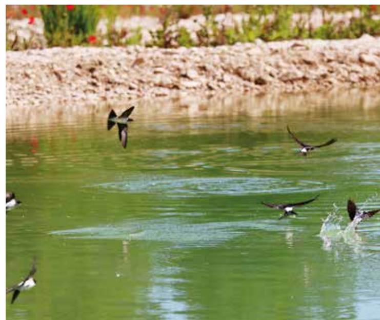
Mehlschwalben beim Wassertrinken in der Weiheranlage