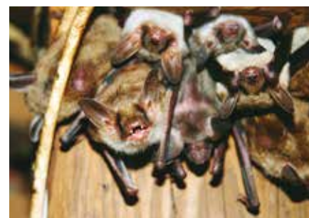
Grosses Mausohr Wochenstubenkolonie

Anschliessend an den Grundkurs kann der Aufbau-Kurs «Aktiver Fledermausschutz in der Gemeinde» besucht werden, um das Diplom einer/s «Lokalen Fledermausschützerin» zu erlangen. Angesprochen sind besonders Personen, welche bereit sind, das Team des Kantonalen Fledermausschutzes auf ehrenamtlicher Basis zu unterstützen und sich nach dem Aufbaukurs in ihrer Wohngemeinde als Lokale Fledermausschützerin (LFS) engagieren möchten.