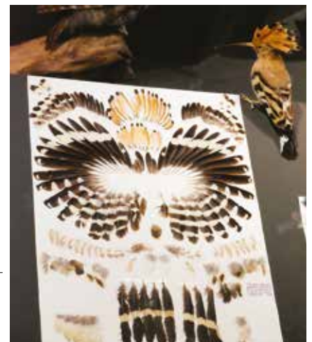
Wiedehopf mit Federkleid

Link: Aktuelle Informationen finden Sie im Internet: www.bnv.ch/anlaesse-kurse/bnv-kurse/weiterbildungskurse