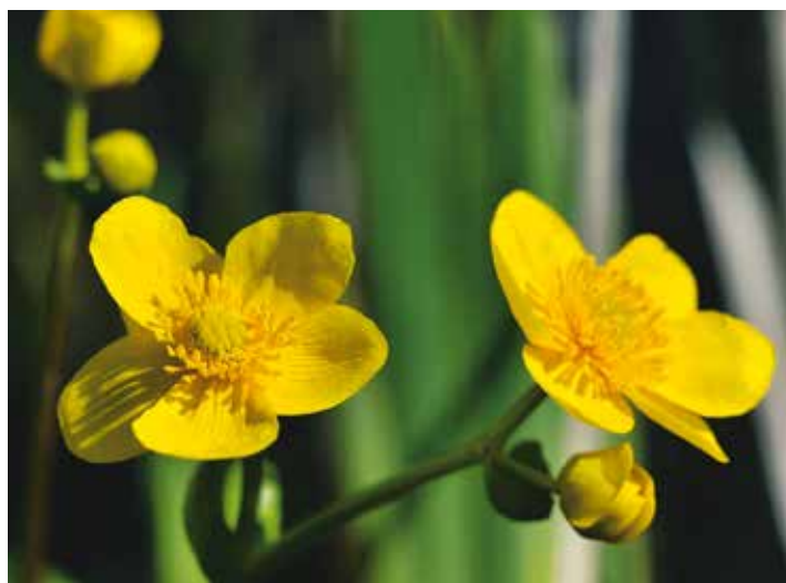
Sumpfdotterblume ( Caltha palustris )