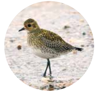
Goldregenpfeifer auf einer Sandbank an der Birmmündung

«Vielen Dank an alle für die gemailten oder per Post gesendeten Beobachtungsmeldungen!» Bitte senden Sie Ihre Meldungen bis spätestens 10. August 2021 an folgende Adresse: Simon Hohl, Bündtenweg 15b, 4416 Bubendorf, simon.hohl@gmx.ch