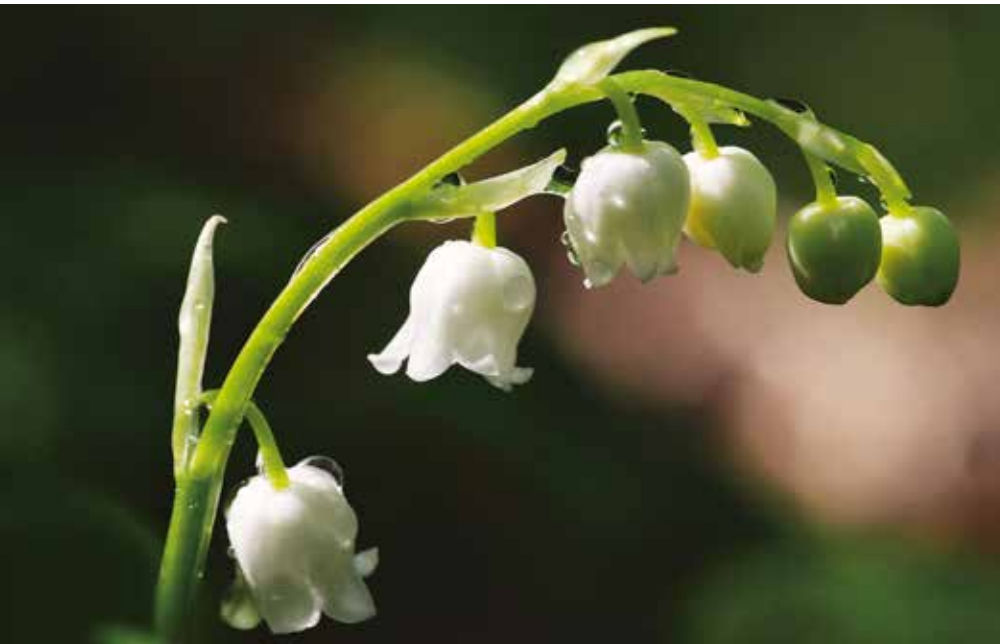
Maiglöckchen ( Convallaria majalis ), Falkenfluh

Text und Bild Carole Wiesmann, FBK-Organisationsteam