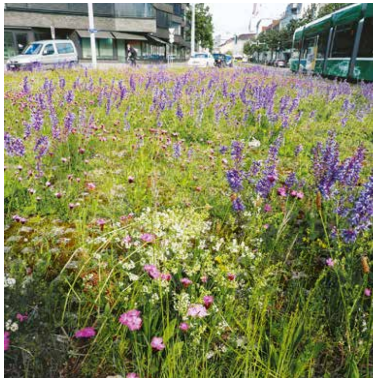
Artenreiche Plätze (Kreisel)

lyse der Grünflächen soll der Gemeinde das Aufwertungspotenzial aufzeigen, Massnahmen vorschlagen und eine Priorisierung vornehmen. Mit diesen Grundlagen kann die Gemeinde nach eigenem Fahrplan in die Umsetzung starten. Die Werkhöfe spielen dabei eine Schlüsselrolle. Sie sind meistens sowohl für die Umsetzung als auch die langfristige Erhaltung der ökologischen Werte verantwortlich. Deshalb sind sie von Anfang an am Projekt beteiligt. Eigenleistungen des Werkhofes können an die Kosten angerechnet werden. Der Ebenrain beteiligt sich dabei mit bis zu 40% der anfallenden Kosten. Dabei handelt es sich um Bundesgelder.