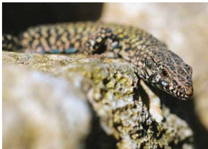
Mauereidechse ( Podarcis muralis )