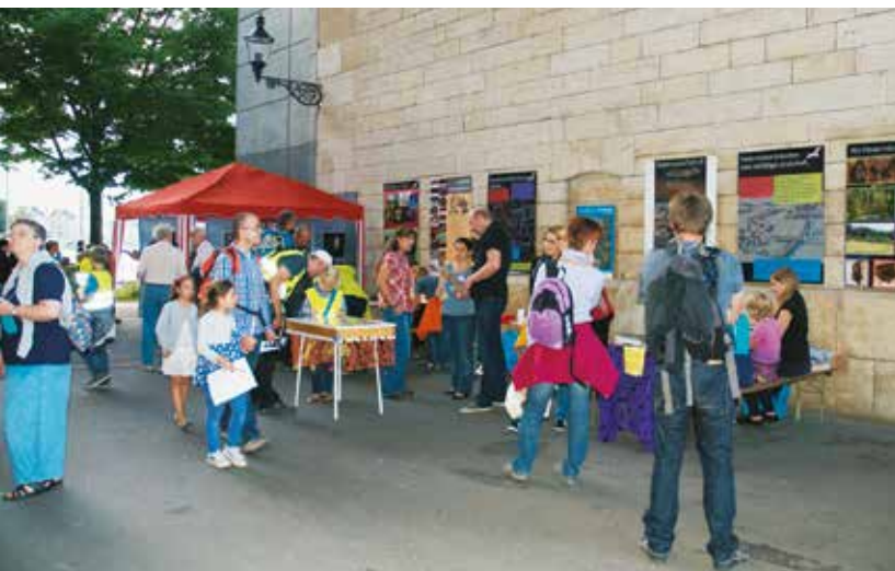
Öffentlichkeitsanlass (Fledermausnacht) mit LFS-Unterstützung

Im Jahr 2014 haben die ersten Lokalen Fledermausschützenden ihre Diplome erhalten, die meisten von ihnen sind aktiv in einer BNV-Sektion tätig. Der dadurch mögliche Einsatz von lokalen Ansprechpersonen in den Gemeinden mit gleichzeitiger Verankerung im Natur- und Vogelschutz ist eine grosse Bereicherung. Besonders unterstützt werde ich von den LFS bei der Erstabklärungen von Quartieren, bei der Quartierbetreuung (Nationale Monitoring Projekte), in der Öffentlichkeitsarbeit und Exkursionsleitung oder, nach abgeschlossener Zusatzausbildung, in der Tierpflege. Ich möchte die Gelegenheit nutzen, «meinen» LFS von Herzen für ihr Engagement zu danken. Egal ob sporadisch oder regelmässig: ihr seid das Fundament des Kantonalen Fledermausschutzes!