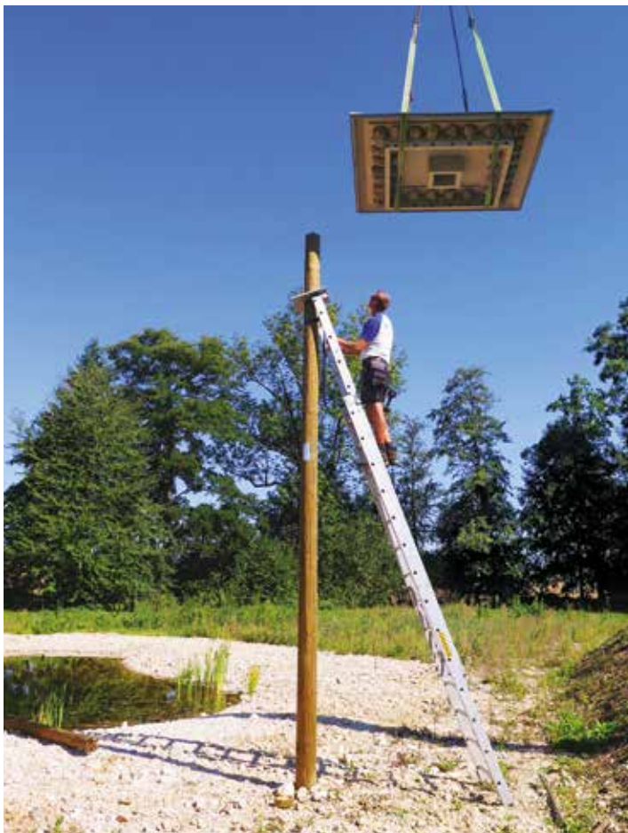
Montage in der «Weiheranlage Toggessenmatten»

Diese Vogelart ist potenziell gefährdet. Erfreulicherweise waren im Sommer 2020 ungewohnt viele Mehlschwalben über dem Dorf zu beobachten. Dazu haben auch die recht zahlreichen Einwohner*innen von Eettingen beigetragen, welche bereit sind, Schwalbennester an ihrem Haus zu dulden und/oder anzubringen. Wir hoffen, dass sich dieses Engagement auszahlt und wir als «Guggerdorf» zwar keine Kuckucke vorweisen können, dafür eine grosse Mehlschwalbenpopulation. Ein grosser Dank allen Mitwirkenden und – liebe Mehlschwalben, seid herzlich willkommen am neuen Wohnort!