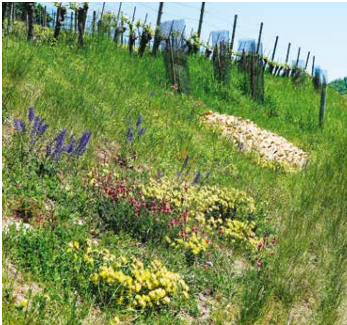
Steinlinse in geschürfter Böschung

Text und Bild Martin Erdmann, Projektleiter, Naturschutzverein MuttENZ