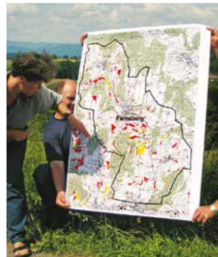
Karte ökologische Infrastrukturprojekte Farnsburg

Christa Glauser von BirdLife Schweiz zeigt auf, was die Ökologische Infrastruktur beinhaltet. In einem Workshop werden wir uns damit auseinandersetzen, wie wir mit diesem Thema auf Landwirtinnen und Landwirte, Gemeinderäte und die Bevölkerung zugehen können. Im dritten Teil wird aufgezeigt, wie man eine ökologische Infrastruktur in der Raumplanung einbringt.