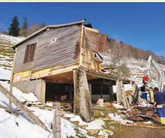
Abbruch alte Unterkunft

nehmlichkeit souverän. Dank ihrem Einsatz werden die Baumeisterarbeiten anfangs Mai abgeschlossen sein. Im Juni folgen dann termingerecht der Holzbau und der Innenausbau. Pünktlich auf die nächste Saison wird dann die Unterkunft für die 60. Aktion bereitstehen.