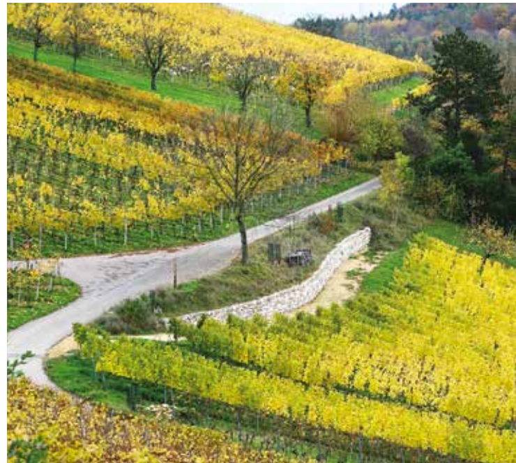
Lange Trockenmauer mit vorgelagertem Magerstandort / Wendefläche

Wie geplant, wurde das vom Naturschutzverein MuttENZ (NVM) im Jahr 2012 initiierte ökologische Aufwertungsprojekt innert 5 Jahren, bis Ende 2020 realisiert. Unter der Leitung von BirdLife Schweiz wird es nun weiterentwickelt.