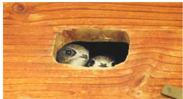
Mauerseglerjunge im Nistkasten.