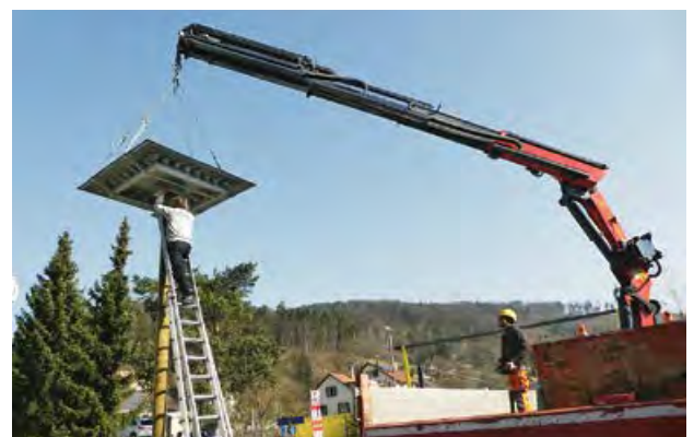
Das Schwalbenhaus wird gezügelt.

Dankbar erfuhren wir, dass die Finanzierung von De- und Neumontage sowie der Transport durch die BGV übernommen wurde und die Primeo Energie den neuen Mast spendete. Nur dank der unkomplizierten Unterstützung aller Involvierten konnte das Projekt so kurzfristig umgesetzt werden! Das Beste daran: Eine Zählung am 6. August ergab, dass 19 Nisthilfen besetzt sind, in mindestens 8 wurden Bruten festgestellt!