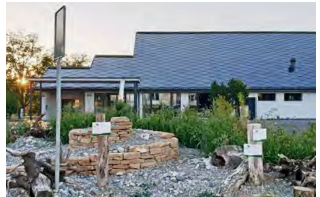
Eine der Flächen zwischen Strasse und Mehrzweckhalle. Trockenmauern und Ruderalflächen sind noch fast kahl. Man darf gespannt sein, was die Natur mit der Zeit hier ansiedelt.

Ende November hat die Gemeinde die finanzielle Unterstützung für einen Schaugarten auf den Flächen zwischen der Mehrzweckhalle und der Strasse gesprochen. Die Flächen sind nicht sehr gross, aber zentral gelegen. Der Schaugarten soll Passantinnen