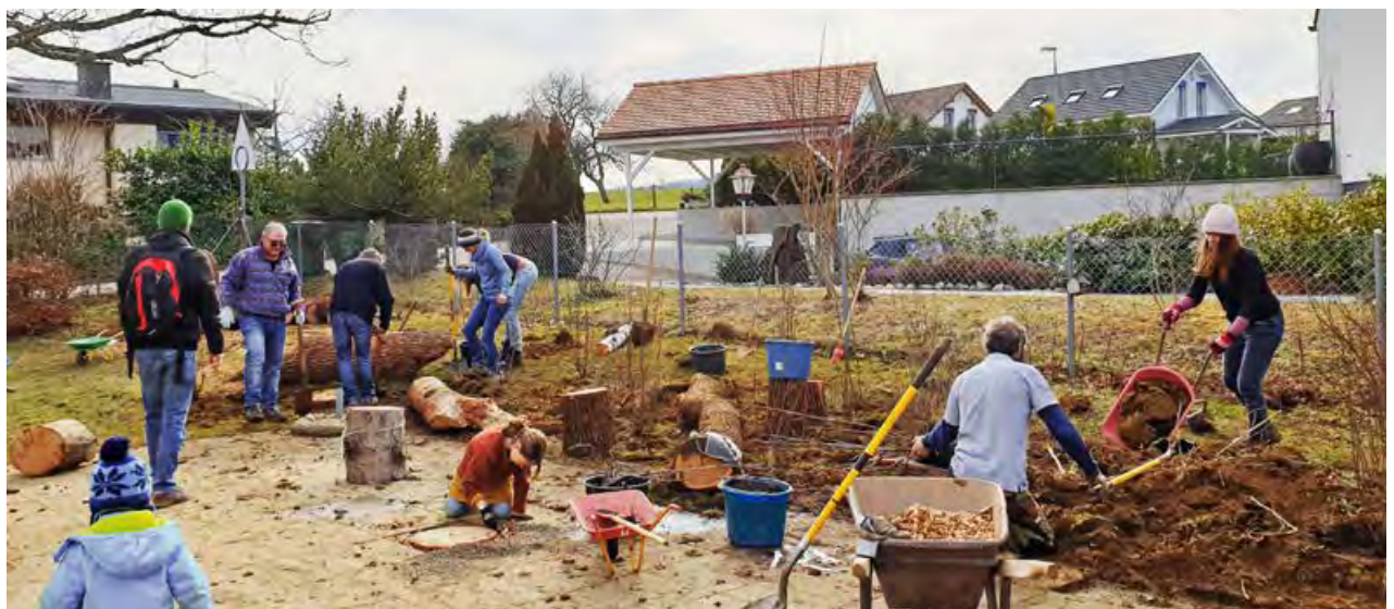
Kinder des Kindergartens Seltisberg mit ihren Eltern und Mitgliedern des NSV pflanzen auf der Spielwiese eine Wildhecke und platzieren Totholz.

und Passanten zeigen, wie sich auch auf kleiner Fläche Artenvielfalt fördern lässt. Initiiert und geplant wurde die Anlage vom NVS. Er übernimmt auch den Unterhalt. Professionelle Gartenbauer haben den Lehrpfad Ende April angelegt. Die Unterstützung durch die Primarschule fiel wegen des Lockdowns aus. Wildblumenwiese, Wildhecke, Ruderalflächen, Trockenmauer, Totholz und eine Sickergrube bieten nun Heimat und Nahrung für Vögel, Insekten, Spinnentiere und kleine Säugetiere und zeigen die Natur im Wandel der Jahreszeiten. Die verschiedenen Elemente werden mit einer Tafel ergänzt, die über den Nutzen informiert. Auch für uns Menschen hat es Platz zum Verweilen, Beobachten und Staunen. Alle sollen sich inspirieren lassen, wie der eigene Garten naturnäher gestaltet werden kann.