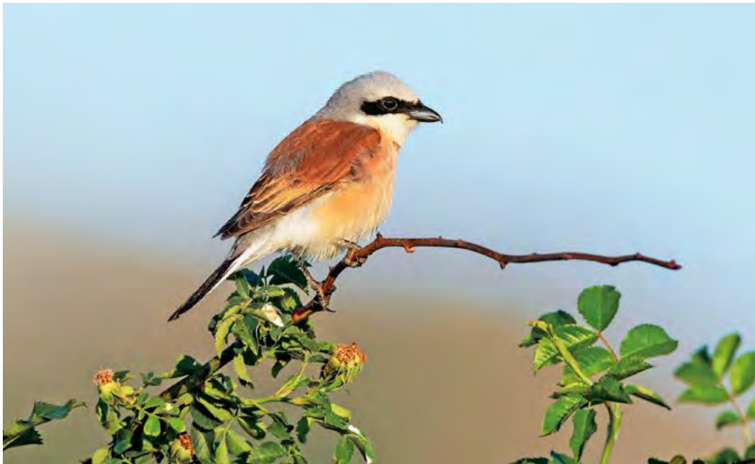
Bild 1, Neuntötermännchen auf Warte