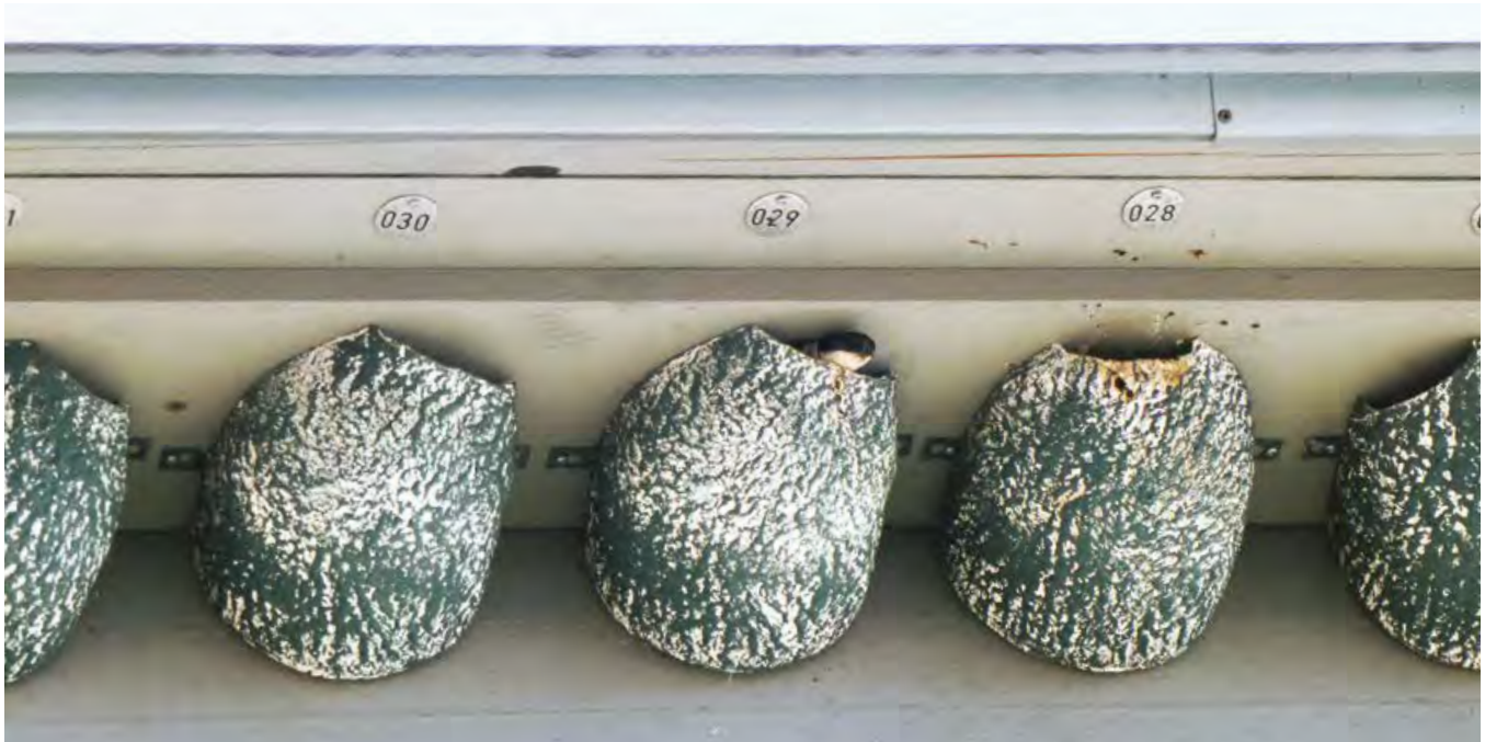
Mehlschwalben haben das Haus am neuen Standort schon angenommen.

Text Bea Steffen, Vorstand NVBDN Bilder zVg.