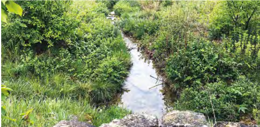
Ausgedoltes Hintereggbächli in Wenslingen.

Text und Bild Ila Geigenfeind, Ausstellungskuratorin Museum.BL