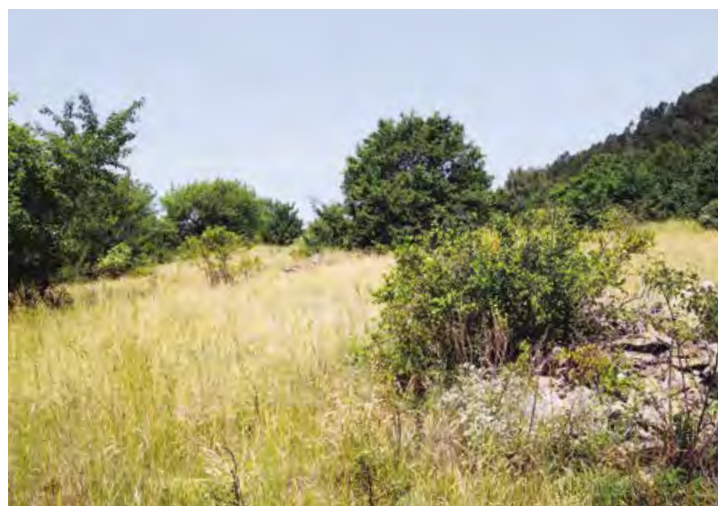
Bild 2, Neuntöter brauchen Dornbuschstrukturen.

Der Vogel des Jahres 2020 von BirdLife Schweiz ist dringend auf Artenförderungsmassnahmen angewiesen. Insbesondere dort, wo noch vereinzelt Neuntöter vorkommen, soll geprüft werden, wo im Umfeld weitere Aufwertungsmassnahmen nötig und möglich sind. BirdLife-Sektionen können für den Neuntöter Hecken pflanzen und den Lebensraum aufwerten. Jetzt ist ein guter Zeitpunkt, um Massnahmen zu planen, seien dies Pflanzungen von Hecken und Dornbüschen oder das Anlegen von Magerwiesen. Zusammen mit Landwirten können im Herbst Büsche gesetzt werden. Zum Ansäen von Magerwiesen ist dann der nächste Frühling der beste Zeitpunkt.